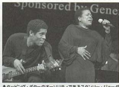
↑タッピング・ギターのオーソリティであるスタンリー・ジョーダン、ディー・ディーやテレンス・プランチャード(tp)らと共演。曲は、ハリケーンで被害を受けたジャズの故郷ニューオーリンズを激励して「ミス・ニューオーリンズ」。

ものと思って楽しみにしていたのですが、渡されたのは、賞金1万ドルの小切手が入ったペラペラのビジネス封筒1枚。